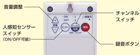
音量調整 人感知センサースイッチ (ON/OFF可能) チャンネルスイッチ 録音ボタン