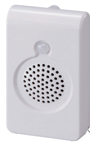
盗難防止用フック